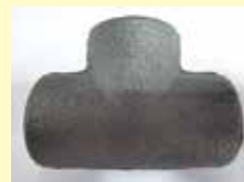
Тройник после абразивной чистки