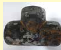
Тройник после т/о с окалинами

Вся продукция проходит очистку от окалины. Очистка осуществляется в струйно-абразивной камере.